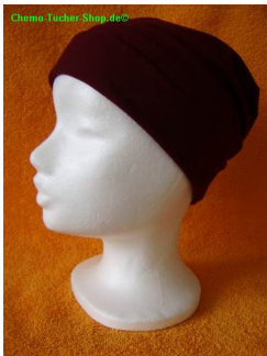
Mütze Chemo Jersey uni burgund meliert